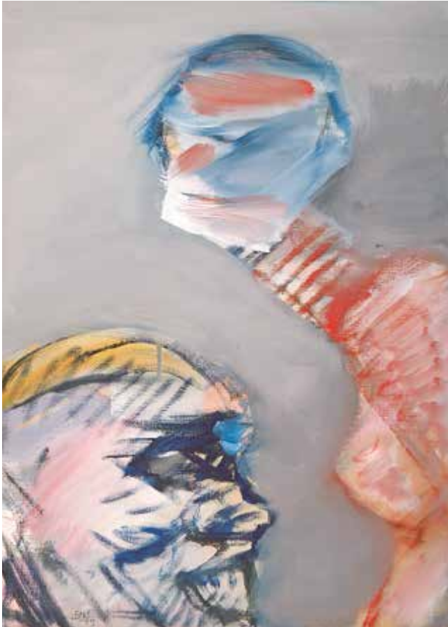
»ohne Titel«, 2005, Öl auf Karton, 40 x 30 cm