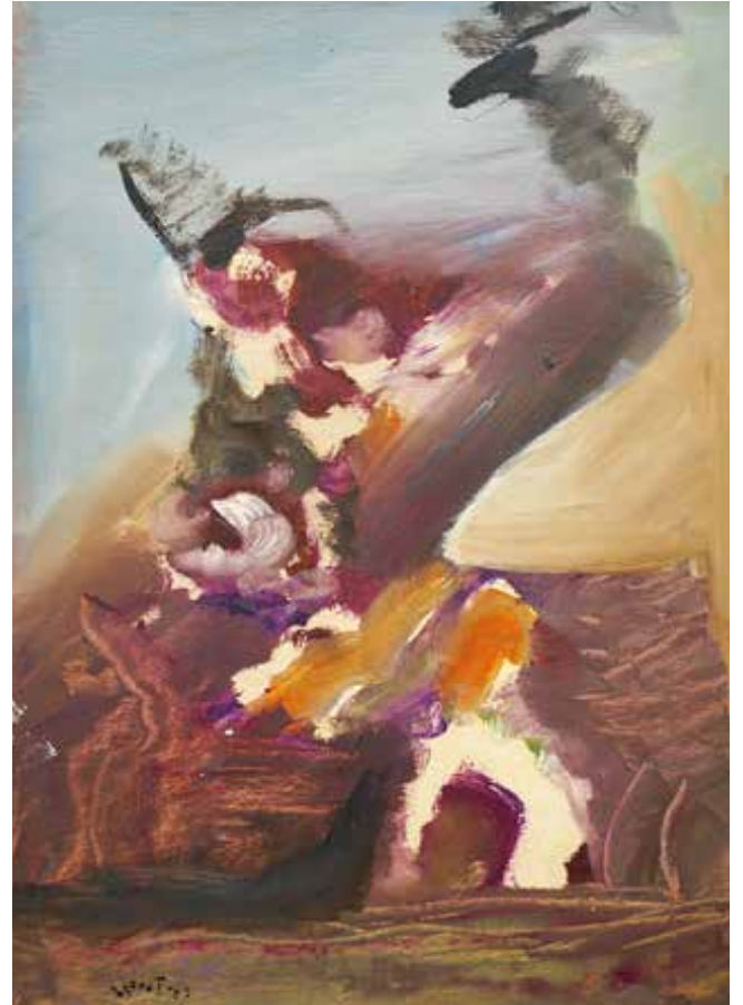
»Studie IV«, 2003, Mischtechnik auf Papier, 30 x 21 cm